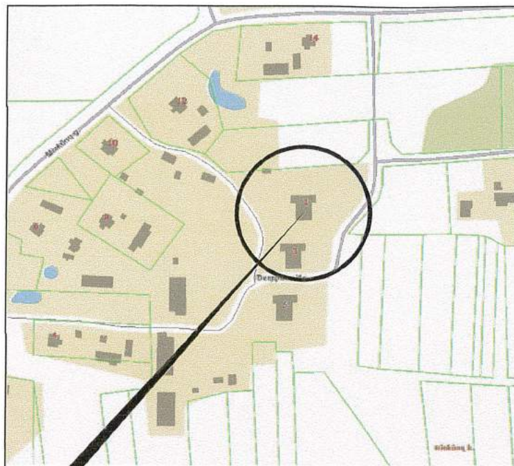
Planuojamos teritorijos situacijos schema